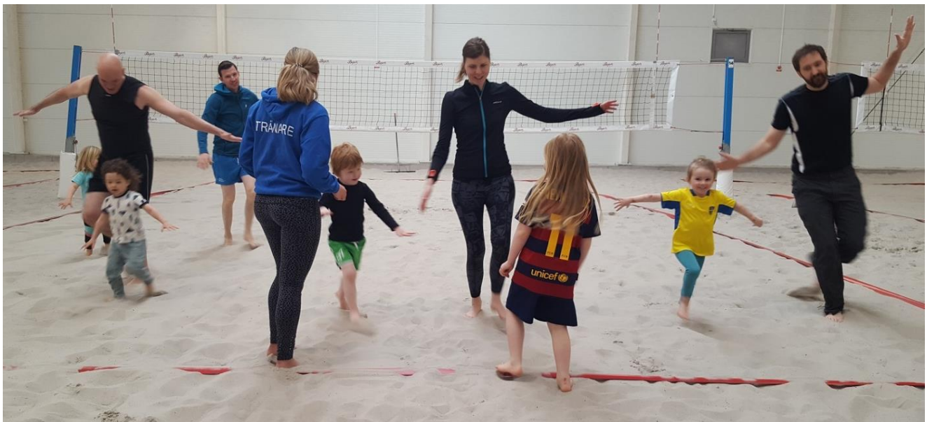
Volleybompa för de minsta!